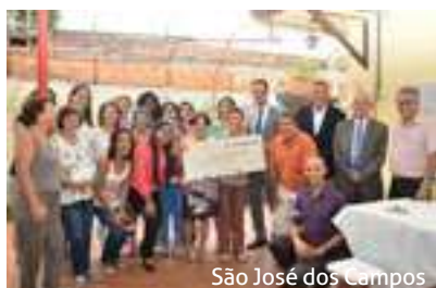
São José dos Campos